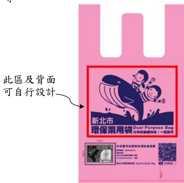
圖例 各合作對象可自行設計環保兩用袋樣式(移除條碼)