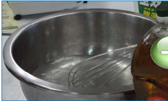
氫氧化鈉加水攪拌