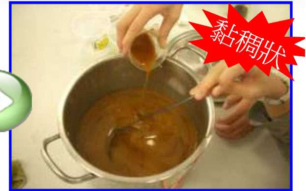
加入香料或 小蘇打粉