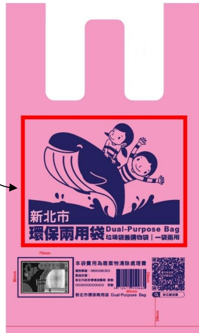
圖例 各合作對象可自行設計環保兩用袋樣式