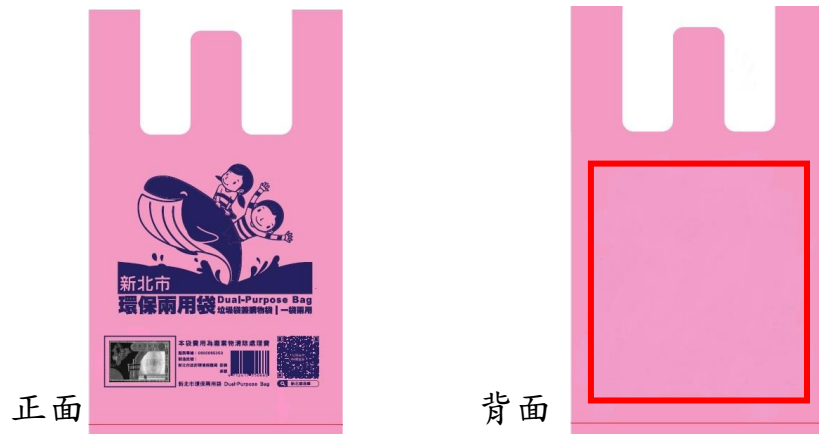
圖例：各申請單位可自行於背面紅框內設計環保兩用袋版面樣式